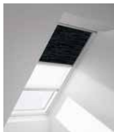
Затемняющая штора «Ду» DFD