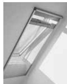
Москитная сетка ZIL