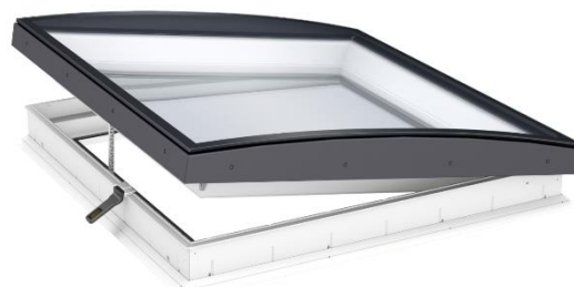
Abbildung zeigt das CVU ohne Photovoltaikzellen