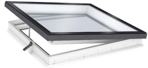
Abbildung zeigt das CVU ohne Photovoltaikzellen