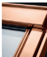
Réz GTU 01__ Kérje árajánlatunkat!