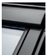
Alumínium GTU 00__