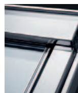
Titáncink GTU 03__ Kérje árajánlatunkat!