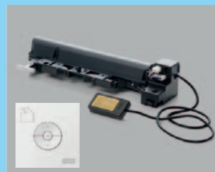
KMG 100 WW

VELUX INTEGRA® ablakmozgató motor CK04-UK10 billenő tetőtéri ablakokhoz. A csomag ablakmozgató motort (20 cm-ig nyit), esőérzékelőt és VELUX INTEGRA® (akár falra is szerelhető) kapcsolót (KLI 311) tartalmaz. Csak a KUX 110 termékkel használható. Minden árnyékoló az ablakmotorra közvetlenül rácsatlakoztatható.