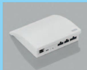
KLF 200 WW

Vezérlési kapacitás: – azonos motorból max. 5 db (pl. 5 db SML redőny) – kétféle motorból max. 2-2 db (pl. 2 db KMG 100K motor + 2 db SML redőny) – háromféle motorból max. 1-1-1 db (pl. 1 db KMG 100K motor, 1 db MML külső hővédő roló, 1 db DML fényzáró roló)