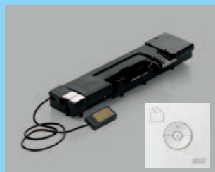
KMG 100K WW