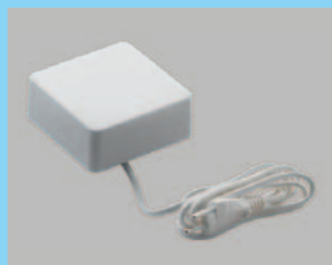
KUX 110 EU

VELUX INTEGRA® ablakmozgató motor 102/C02 – 810/U10 méretű billenő tetőtéri ablakokhoz. A csomag ablakmozgató motort (20 cm-ig nyit), esőérzékelőt és VELUX INTEGRA® (akár falra is szerelhető) kapcsolót (KLI 311) tartalmaz. Csak a KUX 110 termékkel használható.