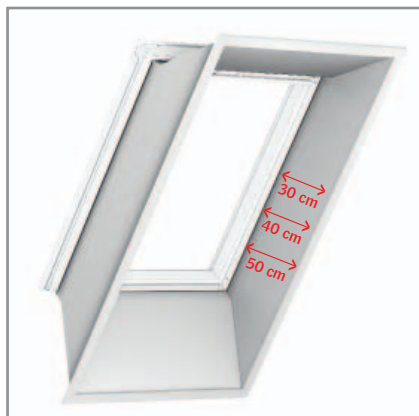
LSB/LSC/LSD Alapelem 30 cm/40 cm/50 cm

17 és 33/43/53 cm közötti tetővastagsághoz (lásd Tetővastagság meghatározása c. pont). Ahhoz, hogy a VELUX tetőtéri ablakot belső oldalon a magastetőhöz rögzítsük, VELUX belső burkolat alapelemre van szükség.