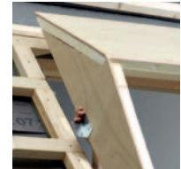
Kiemelőkeret oldalsó elem