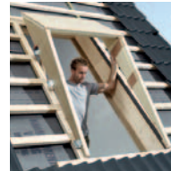
Vízálló rétegelt falemez poliuretán szigeteléssel