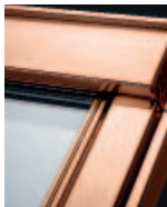
Réz GTU 01__ Kérje áránlatunkat!