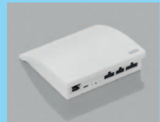
KLF 200 WW 50 315 63 900

Vezérlési kapacitás: – azonos motorból max. 5 db (pl. 5 db SML redőny) – kétféle motorból max. 2-2 db (pl. 2 db KMG 100K motor + 2 db SML redőny) – háromféle motorból max. 1-1-1 db (pl. 1 db KMG 100K motor, 1 db MML hővédő roló, 1 db DML fényzáró roló)