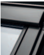
Alumínium GPL 20__