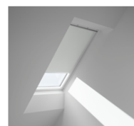
DKL XK99 Codice tessuto: Colori base Operabilità: manuale

NOTA: VELUX Italia S.p.a. si riserva di verificare le tempistiche di consegna indicate a listino a seguito di conferma del preventivo di spesa