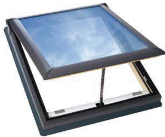
外観色：デニッシュグレー