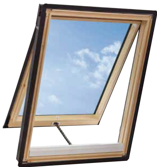
内観色：木杣クリア

高い位置への取り付けに最適。高所でも便利な電動機能を搭載し、さらに網戸も標準装備。快適な室内を演出します。 100V電源への配線直結により、施工の手間も軽減されます。