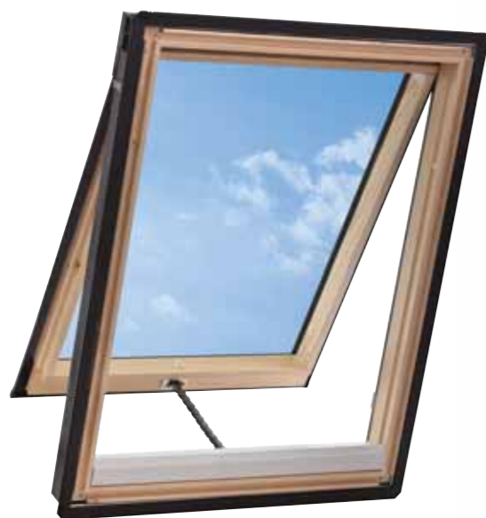
内観色：木杣クリア