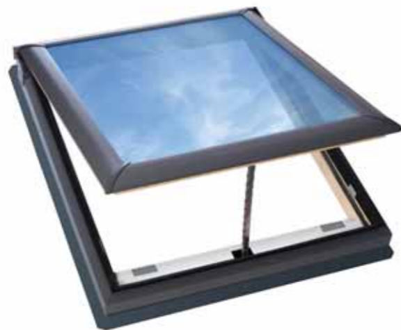
外観色：デニッシュグレー