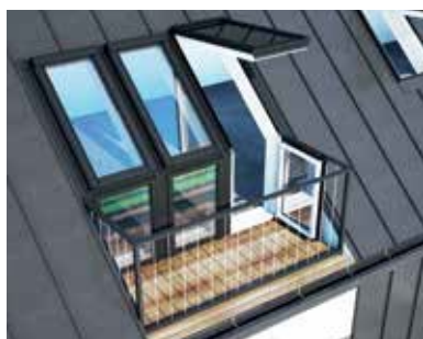
Do dachów bez ścianki kolankowej