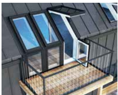
Do dachów ze ścianką kolankową