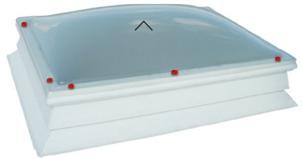
HAGELSTOP, SUPER-TOP, PET-TOP

hochschlagfest erhöhter Widerstand gegen Vandalismus