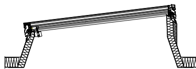
SKYSIGHT auf ISO-THERM Aufsetzkranz 7°