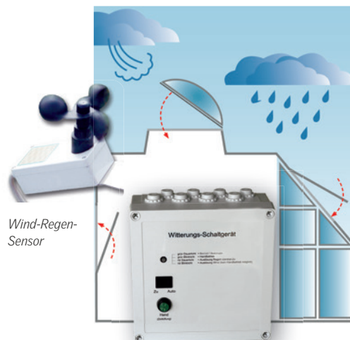
Wind-Regen-Automatik Mehr Sicherheit bei Wind und Regen