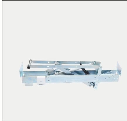
SA Power Single