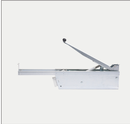
SA Power Mini