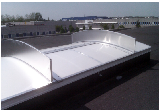
Eksempel på færdigmonterede vindskærme

For at opnå den opgivne Cv-værdi for oplukkefelterne er det nødvendigt at montere de medfølgende vindskærme, én på hver side af et oplukkefelt (I nogle tilfælde sidder oplukkefelterne dog sådan at kun én vindskærm er nødvendig imellem dem). Følg venligst nedenstående montagevejledning: