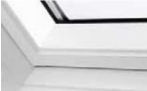
Holz weiß lackiert