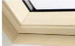
Holz klar lackiert