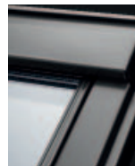
Színre festett GGL 38__ Kérje árajánlatunkat! 50-es üveggel nem rendelhető