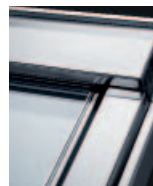
Titáncink GGL 23__ Kérje áránlatunkat! 50-es üveggel nem rendelhető