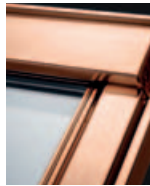
Réz GXL 31__

Kérje áránlatunkat! 50-es üveggel nem rendelhető