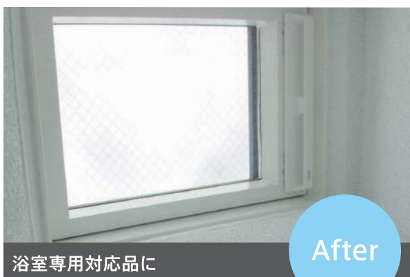
[新しい天窗への交換事例]