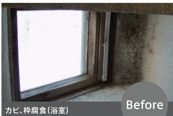
[浴室での枠黒ずみ]