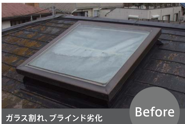
[他社製廃番トップライト]