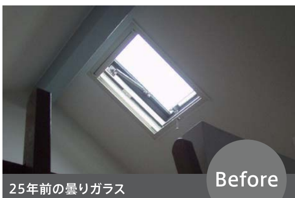
[面積が小さく不満足]