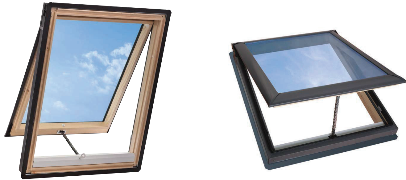
内観色: 木杣クリア

機能の充実に加え、コストパフォーマンスに優れた手動型。 網戸も標準装備されて、四季を通してさわやかな室内環境をお届けします。