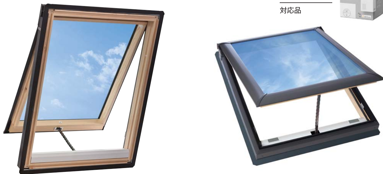
内観色: 木杣クリア

高い位置への取り付けに最適。高所でも便利な電動機能を搭載し、さらに網戸も標準装備。快適な室内を演出します。 100V電源への配線直結により、施工の手間も軽減されます。