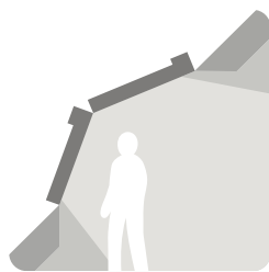
VELUX dakkapel serre