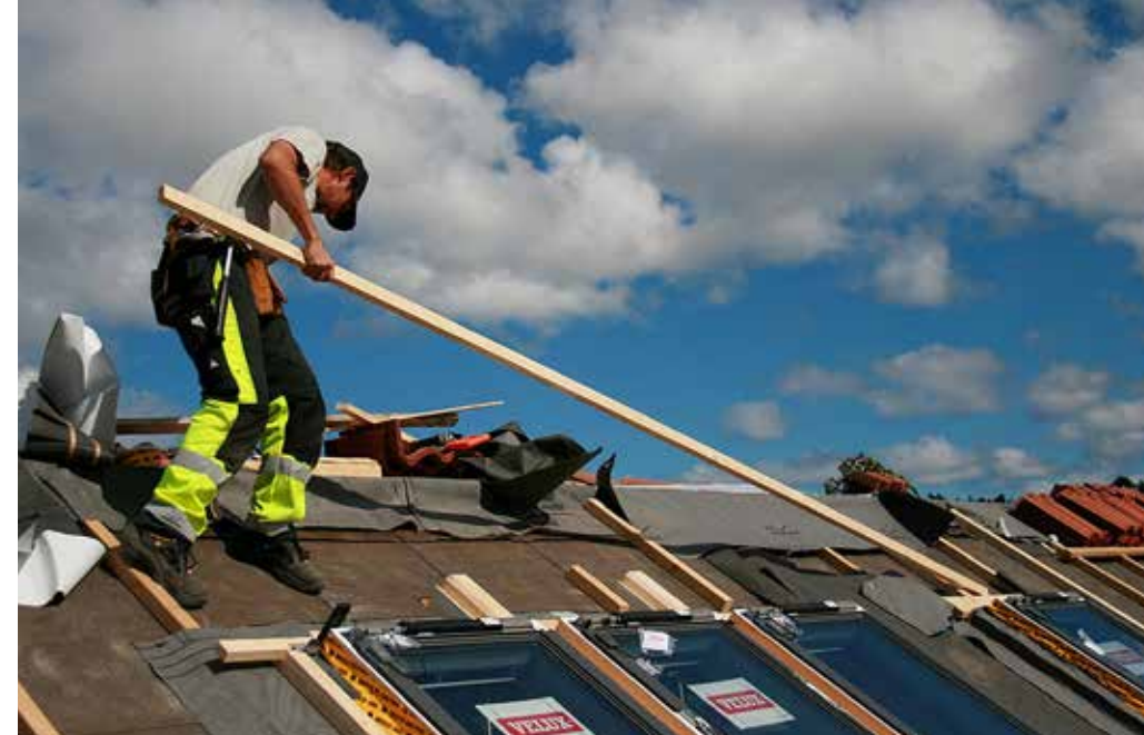
Du finner en oversikt over snekkere som kan sette inn VELUX takvinduer på www.velux.no