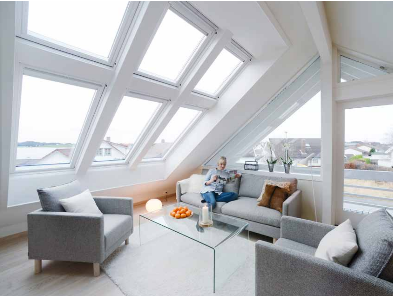
Nye vinduer i taket gjorde underverker for rommet både med hensyn til plass og lys.