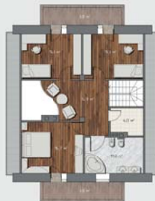
Название «Лаконичность» Современный дом на семью из 4 человек с гостевой комнатой. Площадь: 350 кв. м; Жилая площадь: 200 кв. м