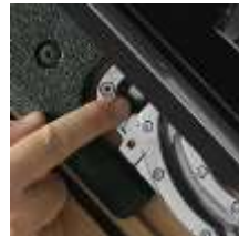
3 Накладки на защелках

Модель, код размера, вариант исполнения Производственный код