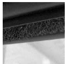
8 Фильтр от пыли и насекомых

Улучшенное теплосбережение R_w 0,9 Закаленное внешнее стекло