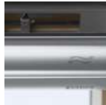
4 Ручка управления с вентиляционным клапаном