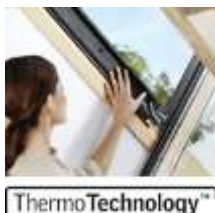
6 Отличная теплоизоляция