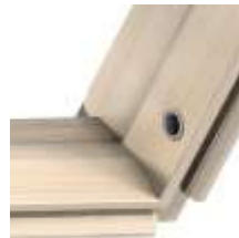
11 Гнездо для шпингалета

Гальванизированная сталь Цвет: серебристый