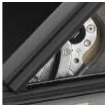
10 Фрикционные шарниры

Фиксирует окно в двух положениях: для проветривания и для обслуживания