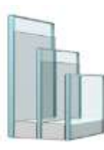
7 Двухкамерный стеклопакет

Улучшенное теплосбережение R_w 0,9 Закаленное внешнее стекло