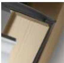
5 Уплотнительные контуры