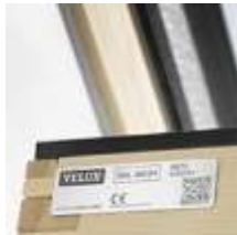
2 Табличка с данными о модели

Гальванизированная сталь Цвет: серебристый